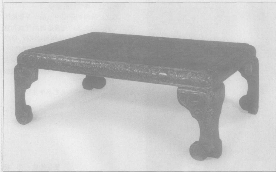
明代·堆漆彩绘大炕桌