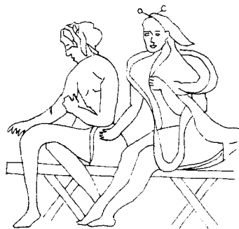
图3 敦煌北魏壁画双人座胡床