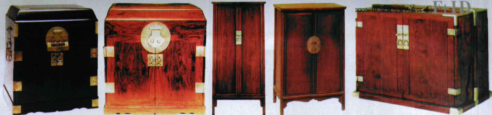
图1 紫檀官皮箱配以黄铜饰件