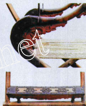
图6(c) 黄花梨餐桌铁镀金包角