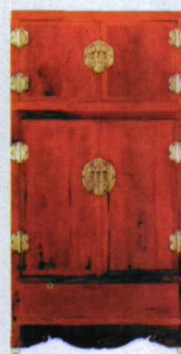
图9 黄花梨龙纹官皮箱