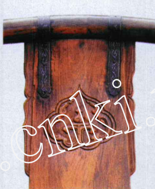
图6(b) 交椅侧面角牙及镀银饰件